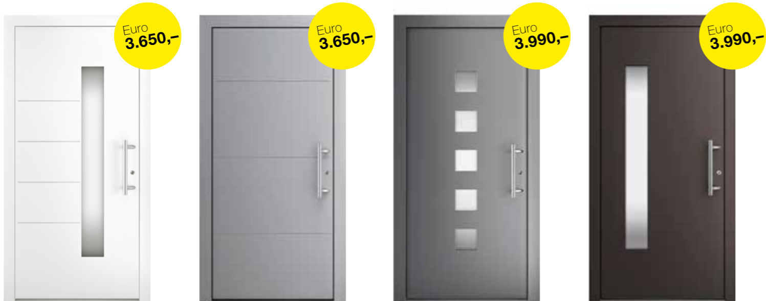
AT 510 Modell FA