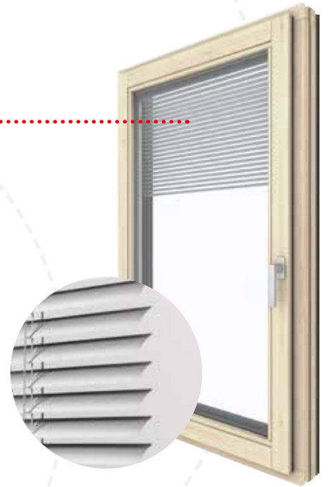
HV 350 Innen Fichte | F1501

Der dekorative Faltenlook am Fenster ist speziell in Wohn-, Schlaf- oder Kinderzimmern beliebt. Durch die Flexibilität kann der Faltstore in nahezu jede Fensterform eingebaut werden. Viele Stoffe und Farben stehen Ihnen zur Auswahl.