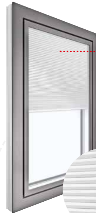
KV 350 Aussen Aluminium-Schale | HM907