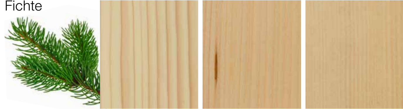
Beispielfotos einzelner Holzeigenschaften

Die Fichte ist der Universalkönner unter den Holzarten. Sie ist leicht und doch sehr stabil. Wie alle Nadelhölzer schützt sie sich mit Harzen und ätherischen Ölen vor Schädlingen und schließt damit Verletzungen. Das zeigt sich gelegentlich durch kleine Harzstriche, Asteinschlüsse, unterschiedliche Farbgebung und unterschiedliche Jahrringbreiten. Die Jahrringe sind, wie bei allen heimischen Nadelhölzern, deutlich voneinander abgesetzt. Innerhalb der Jahrringe lässt sich der Übergang vom hellen, weißlichen Frühholz zum dunkleren rötlichgelben Spätholz erkennen. Dieser deutliche Kontrast zwischen Früh- und Spätholz ergibt eine ausgeprägte Jahrringstruktur – mit zum Teil deutlichen Farbunterschieden. Sehr gut geeignet ist das Fichtenholz für unterschiedliche Farbgebung durch speziell lasierte Oberflächenbehandlungen sowie deckende Lackoberflächen. Seine Struktur, ein leichtes Quellen von Frühholz zu Spätholz und sein natürliches Farbenspiel kann die Haptik und den Endfarbton gegenüber unseren Farbmusterplättchen beeinflussen.