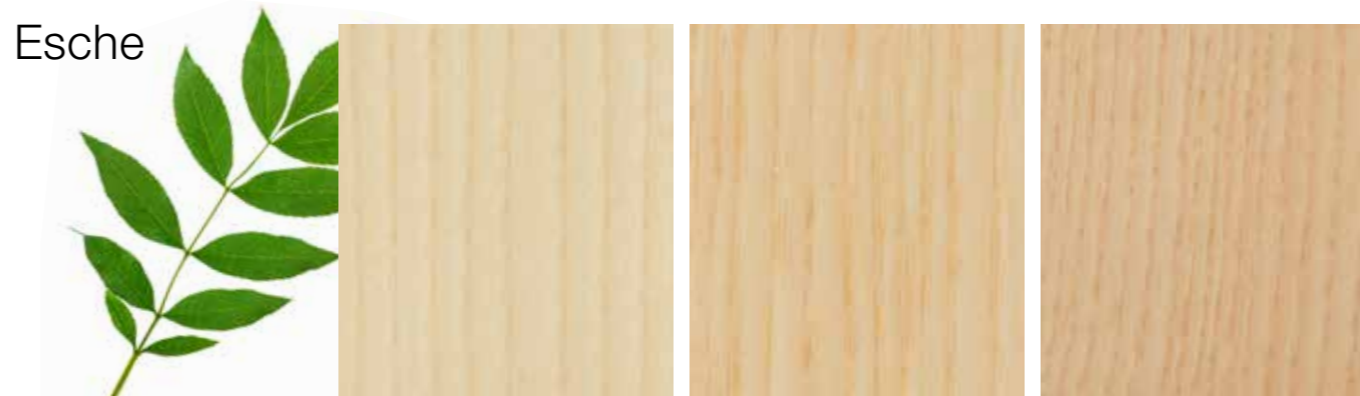
Beispielfotos einzelner Holzeigenschaften

Die Esche ist ein Laubbaum und zeichnet sich durch ihr ringporiges und zum Teil grob-strukturreiches Maserbild aus. Ihr Porenbild ist farblich vielseitig und reicht von weißlich hell über gelblich bis zu leicht rötlich, manchmal sogar leicht bräunlich. Deutlich sichtbare Farbschattierungen sind typisch für die Esche.