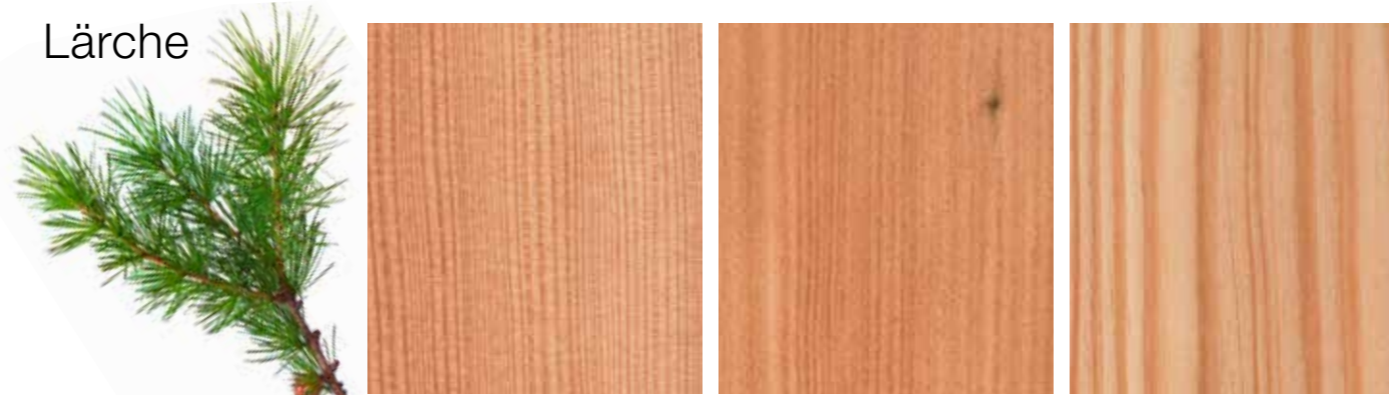
Beispielfotos einzelner Holzeigenschaften

Die Lärche ist ein Nadelbaum. Sie wächst dort, wo die Wetterbedingungen am härtesten sind (z. B. am Berg) und fühlt sich dort am wohlsten. Ihr sehr lebhaftes Faser-/Farbbild ergibt sich durch den regelmäßigen Wechsel zwischen hellem Frühholz und dem scharf abgegrenzten dunkleren Spätholz, mit deutlich unterschiedlichen Jahrringbreiten. Bei der Lärche ist es kaum möglich, ein einheitliches Faser-/Farbbild am Fenster zu erzielen, da sie typischerweise lebhaftere Strukturen, Farben und unterschiedliche Jahresringbreite aufweist. Um die schöne Färbung und Struktur des Holzes zu unterstreichen, werden farblos geölte oder farblos-pigmentierte Lasuren verwendet.