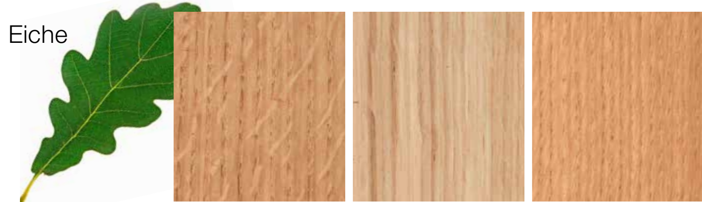
Beispielfotos einzelner Holzeigenschaften

Das dichtfaserige Eichenholz hat eine ungleichmäßige, robuste Oberflächenstruktur mit einem natürlichen Charakter. Durch seine markante Struktur, die von bräunlich-gelblichen Maserungen und dadurch unterschiedlicher Farbgebung geprägt ist, ergibt sich ein spezielles Faserbild. Als „Spiegel“ bezeichnet man im Holz vorkommende, meist hellere und glänzend schimmernde Stellen, hervorgerufen durch den radialen Einschnitt in den Stamm. Diese treten bei der Eiche häufig auf und sind ein charakteristisches Merkmal.