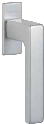
Klika G80 s plochou rozetou obr. v barvě „přírodní hliník“ číslo výrobku 36435