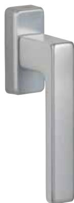
Klika G80 obr. v barvě „přírodní hliník“ číslo výrobku 36404 (číslo výrobku 36505 pro KF310/KF320/KV350)