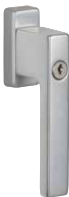
Klika G80 uzamykatelná obr. v barvě „přírodní hliník“ číslo výrobku 36400