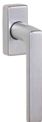
Klika Secustik® Dallas obr. v barvě „přírodní hliník“ číslo výrobku 36426