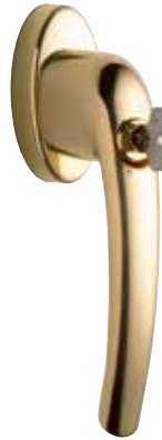
Klika uzamykatelná obr. v barvě „mosaz“ číslo výrobku 33886