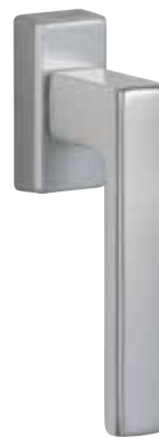
Klika Secustik® G80 obr. v barvě „přírodní hliník“ číslo výrobku 36428