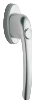
Klika s pojistkou obr. v barvě „přírodní hliník“ číslo výrobku 33885