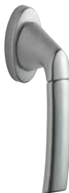
Ozdobná Klika Bruxelles obr. v barvě „satinovaný chrom“ číslo výrobku 34592