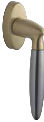
Ozdobná Klika Athanai obr. v barvě „mosaz matná / šedý hliník“ číslo výrobku 34594