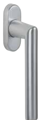
Klika Amsterdam obr. v barvě „přírodní hliník“ číslo výrobku 36416