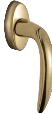
Ozdobná klika Atlanta obr. v barvě „mosaz“ číslo výrobku 34750