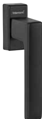
SecuForte® obr. v barvě „černá matná“ číslo výrobku 36132