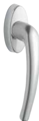
Standardní klika obr. v barvě „přírodní hliník“ číslo výrobku 33899 (číslo výrobku 36504 pro KF310/KV350)