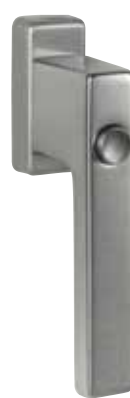
Klika G80 s pojistkou obr. v barvě „šedý hliník“ číslo výrobku 36394