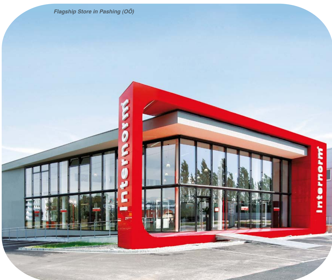
Flagship Store in Pashing (OÖ)

Internorm-Fenster-Telefon zum Gratis-Tarif: 800 017701